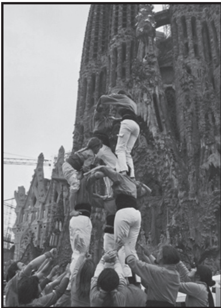
Exhibició castellera durant la I Calçotada en defensa de la Cultura Popular de l'Assemblea de Joves de l'Eixample Nord

L'acte estarà marcat per un fort component reivindicatiu contra totes les formes del patriarcat